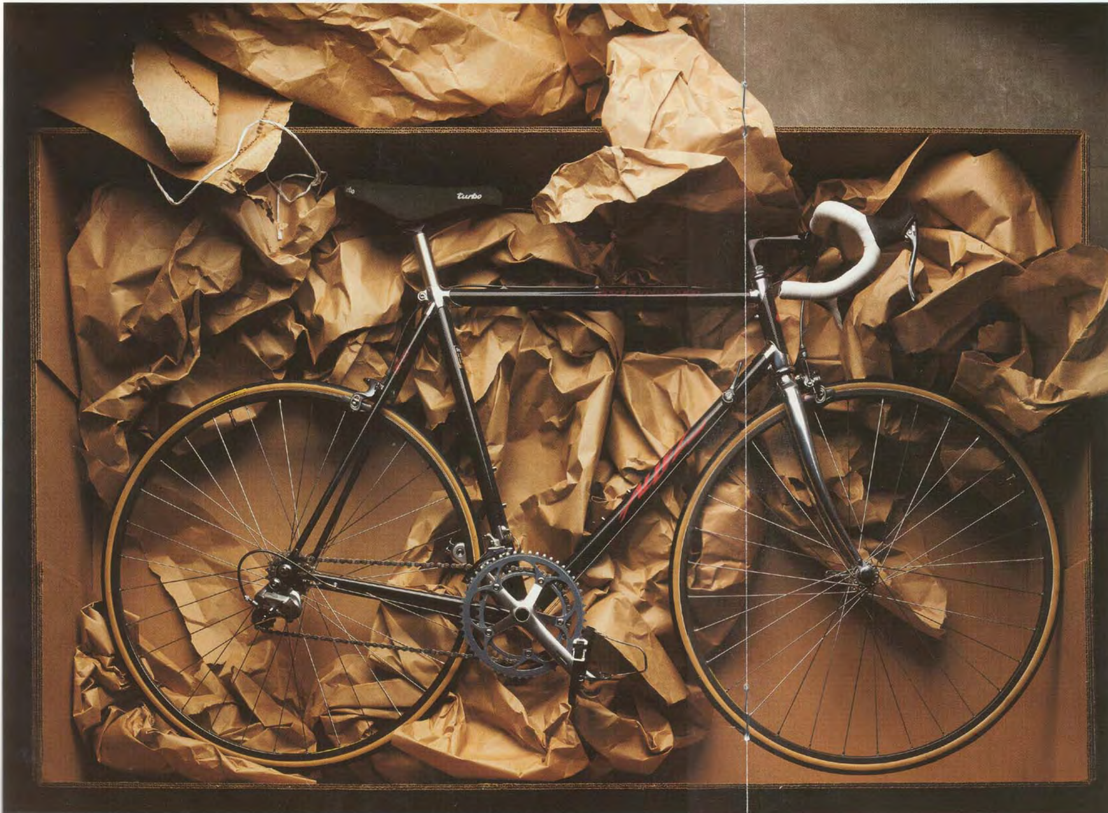
DAS ALLEZ EPIC 1990, RENNBEREIT.