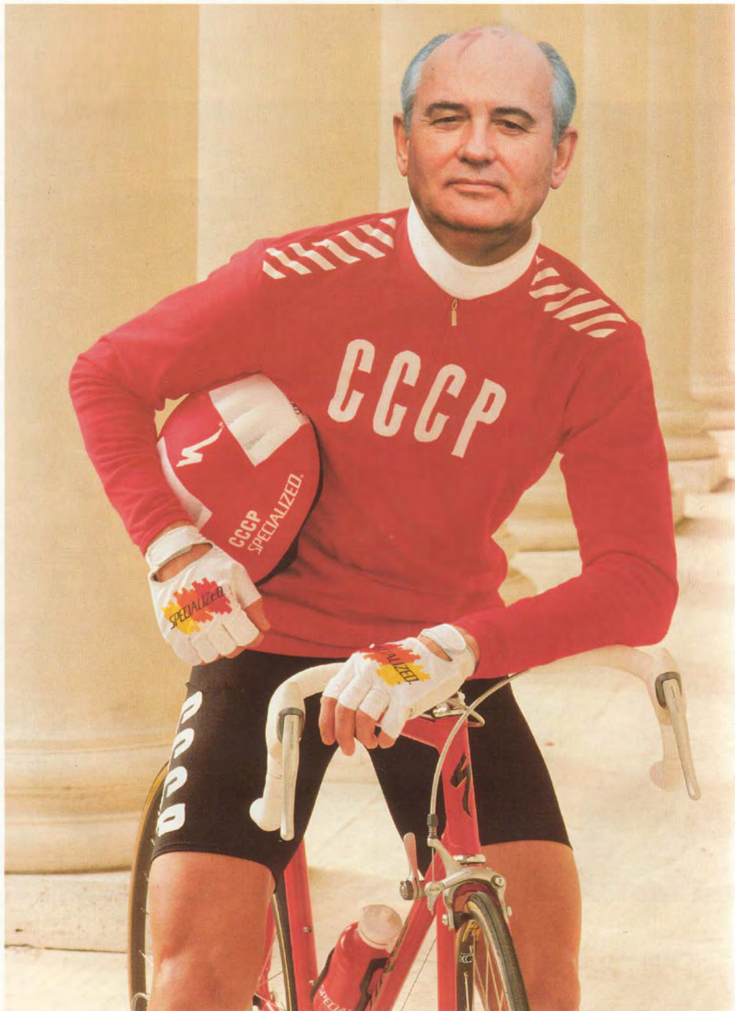
HERR GORBATSCHOW AUF EINEM SIRRUS™ VON SPECIALIZED, DREIMAL NACHEINANDER VON DER ZEITSCHRIFT BICYCLE GUIDE ALS BESTES RAD