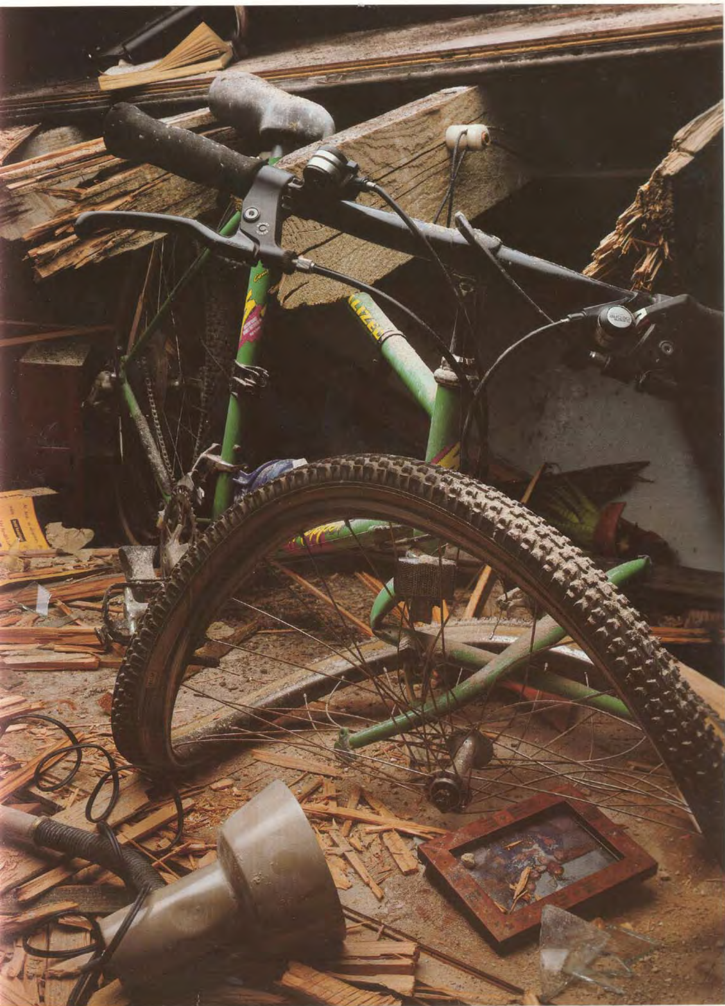
EIN ROCKHOPPER® COMP, JG. 1988, NACH 7,1 AUF DER RICHTERSKALA . . .