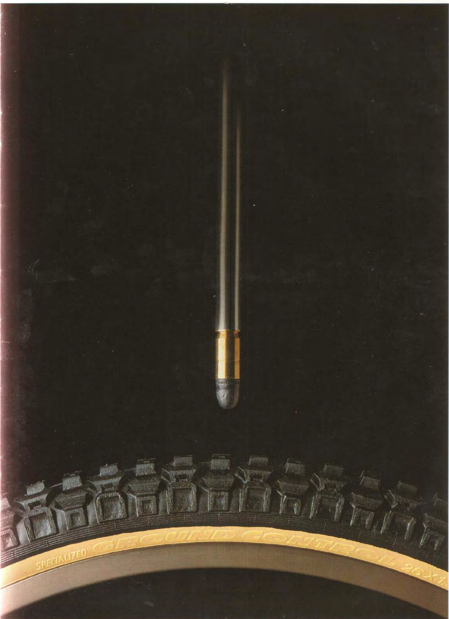
DER GROUND CONTROL K4 BEHAUPTET SICH GEGEN EINEN SCHNÖDEN FREMDKÖRPER.