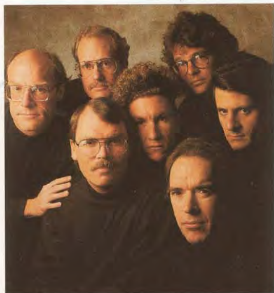
IN IHRER GEGEND GIBT'S SICHER EINEN BERG, DER AUF SIE EBENSO GROSSEN EINDRUCK MACHT, WIE DER TAMALPAIS AUF UNS. SONST MÜSSEN SIE HALT RÜBERKOMMEN.

LETZTLICH WURDEN DAS RAD UND DAS MOUNTAIN BIKE FÜR JEDEN ERFUNDEN. IN 300 MILLIONEN JAHREN SPRICHT MAN DANN VIELLEICHT VON DEN VERRÜCKTEN EINGEBORENEN, DIE IN DIESER GEGEND MIT DEM MOUNTAIN BIKE IHR UNWESEN TRIEBEN. VIELLEICHT FÄLLT DANN AUCH DER NAME SPECIALIZED.